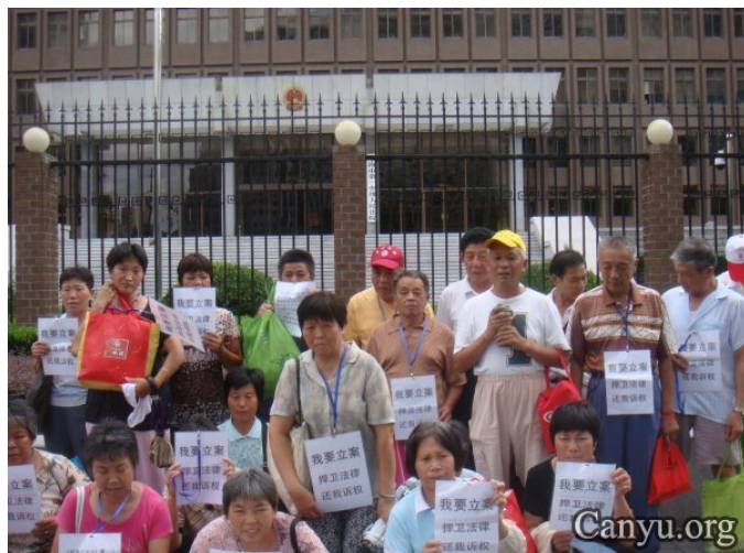
莘庄工业区失地农民冒着高温在一中院前要立案

要立案的失地农民，最大年龄已有 80 多岁了，平均年龄已超过 60 岁了。按理这些老农民艰苦奋斗了大半辈子，理应享福了。是谁逼得他（她）们夏天顶着烈日，冬天抗着刺骨寒风几年如一日上访？又是谁逼得他（她）们一次一次往返于法院之间？社会难道不该关注和反思吗？如果社会都麻木了，背负监督责任的各新闻单位都视而不见了，那么我们还谈什么良知了。人失去了良知就会犯罪；社会失去了良知，社会就会混乱。