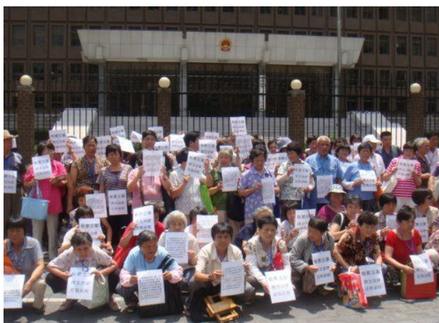
抗议上海第一中级人民法院司法不作为