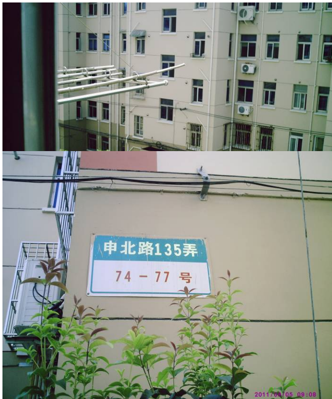
受贿给大、小干部的整栋大楼

不怕辛苦，一大早赶往一中院。今天静坐在一中院的有三十多个老农民，他（她）们是代表近百名莘庄工业区失地农民要立案的。