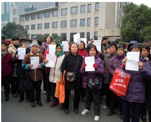
失地农民在上海市政府门前请愿

工业区农民的土地被政府官商勾结以 1.2 万元/亩收购倒卖，菜地以最高 6 千元/亩强抢，受法律保护宅基地也被“无偿”占有。