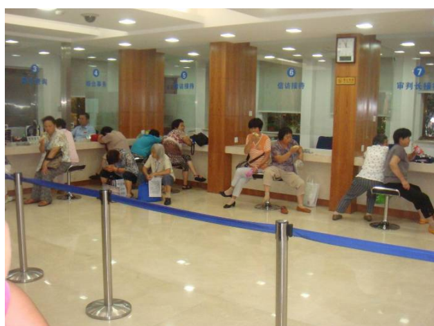
静坐立案大厅等待立案

我们的国家是由人民组成的，我们的法院也是人民的，所以称人民法院。国家制定法律时总是把人民的利益放在前面，以法治国是推动社会发展的保障，法律保障了每个公民享有合法的诉权。