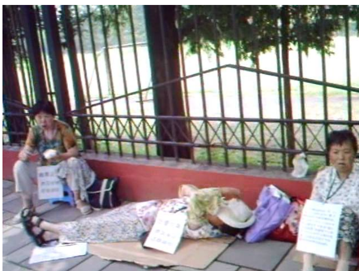
法院中午休息，农民们被赶出法院，他们无奈在高温下，找个遮荫的地方啃干粮休息。

今天是 8 月 1 日，失地农民在高院要求立案已经是第 11 天了，气温虽然已下降到了 33℃ 左右，但天气依然很闷热。失地农民要立案要维权的热情和决心丝毫不退，许多人抽出了一天中宝贵的时间，从早上 8 点左右就踏上了高院之路。