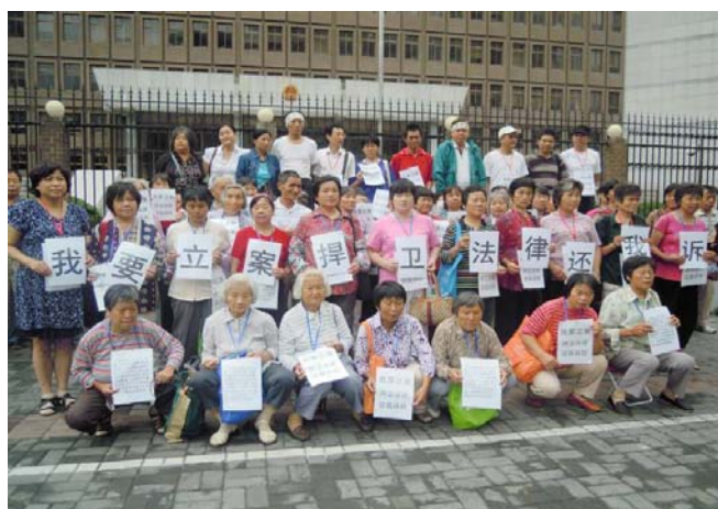
我要立案，捍卫法律，还我诉权。

如今法院大门虽然开着，我们也像上班一样天天在法院候着法官大人的开恩。可政府派来谈话的官员口中所说：“法院是永远不会给你们立案的”。法官们的态度印证了一个基本事实：告区政府，告区政府的企业，法院一千天、一万天也永不立案。什么法律规定、最高法院的规定，在我们地方现官永远比央官大，我不睬你们这些“泥腿子”，你们奈何不了我。人说：法律是武器，法律面前人人平等。可如今法院一把利剑指向维权者，把维权同政治相连，同所谓法轮功，同反革命相连起来，真是吓死人。而那些贪官、渎职和腐败份子成了握剑之人，站在不义之财上手舞足蹈。是啊！如此苦了我们失地农民，叫天天不应，叫地地不灵。