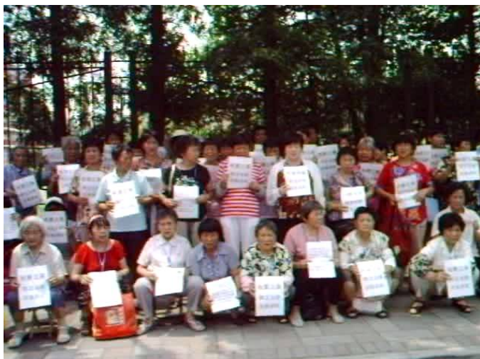
静坐上海高级法院第八天

拿了等候号，又过了很长时间拿到接访单子，填了我要立案，静候院长和立案庭庭长的接见。一天、两天……八天过去了，始终不见院长、庭长大人，他们太忙了吧？大门里面屏幕上一心为民的承诺一天要播放上百次，可各位法官都好像视而不见。